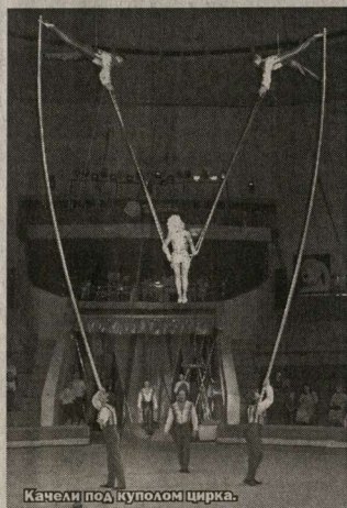
Качели под куполом цирка.