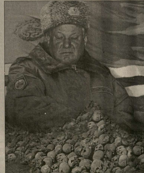
«Белый дом» это было только начало

Ни президент страны, ни новый министр обороны СССР маршал авиации Евгений Шапошников не выразили по поводу смерти Ахромеева никаких публичных соболезнований. Наибольшее