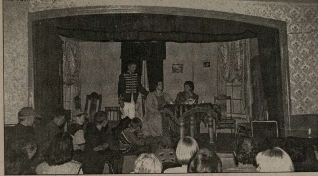
На сцене - актеры из Панина.