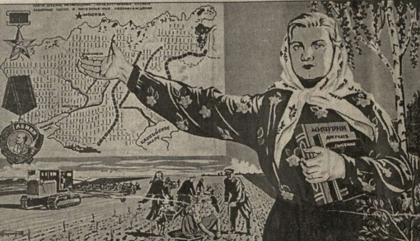
Товарищи колхозники! Досрочно выполним Государственный план посадки лесных полос. Они защитят наши поля от суховея и создадут условия для получения высоких устойчивых урожаев.

Ответом на этот вопрос служит ст. 7 Закона «О ветеранах», согласно которой ветеранами труда являются лица, награжденные орденами и медалями, либо удостоенные почетных званий СССР или Российской Федерации, либо награжденные ведомственными