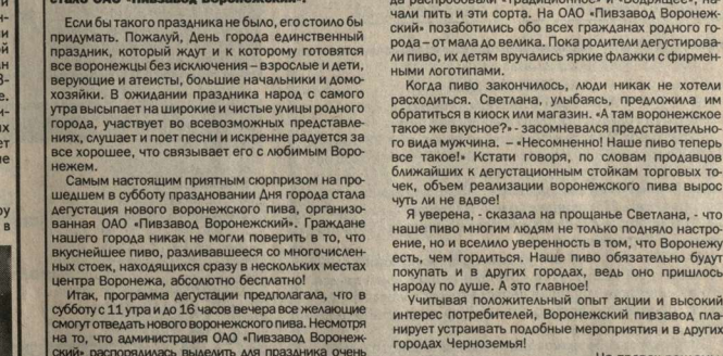
К дегустационным стойкам Воронежского пивзавода выстраивались огромные очереди.

Какому сорту воронежского пива люди отдавали предпочтение?