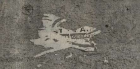
Воронеж: «пятна» на главном проспекте.

Омск: Всяма показательно и результаты полевых испытаний «Енисеев-1200 НМ» в ЗАО «Солнечное» Омской области. Там сама природа создала дополнительные трудности. Накануне испытаний прошел дождь, и уборка велась на поле с повышенной влажностью зерна. Кроме того, урожайность в 32,5 центнера с гектара была несколько ниже для комбайна такого класса. Однако, не смотря на то, что полученные данные, к удивлению всех присутствующих, превзошли технические характеристики, указанные заводом-изготовителем. Производительность составила 11,42 т/ч при норме 9 т/ч, потери зерна — 0,9%, при