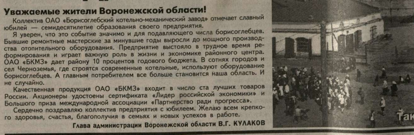
Так начинался завод.