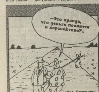
«Это правда, что деньги появятся в перспективе?»

«Главная, конечно же, в том, что в стране «развитого социализма», из которой мы родом, всеские «разогнаны» деньги.