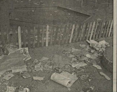
Это — тоже Воронеж.

Но почему же у нас такая участливость только перед лицом смерти, в часы тяжелейших испытаний? Почему в обычные, мирные дни мы так ненавидим друг друга? В Воронеж не доводится бороться так часто. А вот три недели назад пришлось приехать по необходимости. Честно сказать, поразила, с какой неприязнью относятся горожане друг к другу. В маршрутных автобусах наблюдал, как с перекосенной от злобы лицом молодая женщина-кондуктор кричала на ветеранов-льготников и пыталась вытолкать их из автобуса. Они отвечали ей с меньшей яростью и упорно продолжали лезть в двери, как будто это были вражеские окопы. На пере-