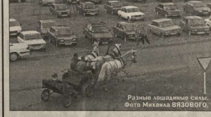
Разные лошадиные силы. Фото Михаила ВЯЗОВОГО.

Виталий ЧЕРНИКОВ. Фото Михаила ВЯЗОВОГО.