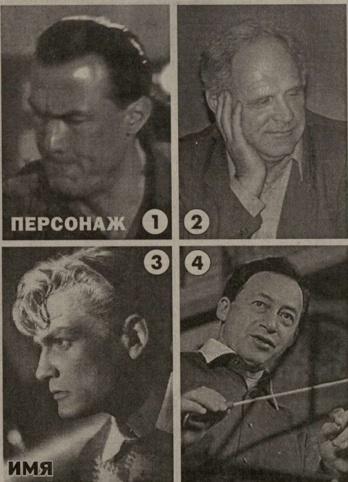
ПЕРСОНАЖ 1 2