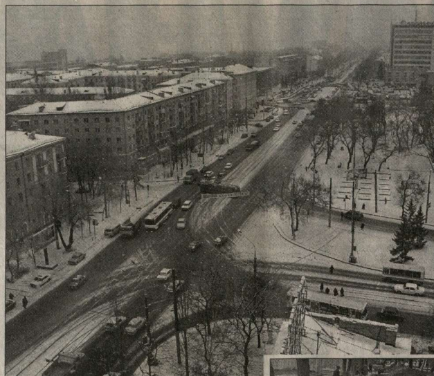
Красив Воронеж с высоты! А если спуститься на землю...