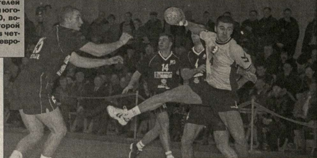
В атаке «Энергия»

Победив в повторном матче 1/8 финала Кубка обладателей кубков европейских стран югославский «Ловчен» - 2:0, воронжская «Энергия» второй год подряд пробивается в четвертьфинал престижного европейского турнира.