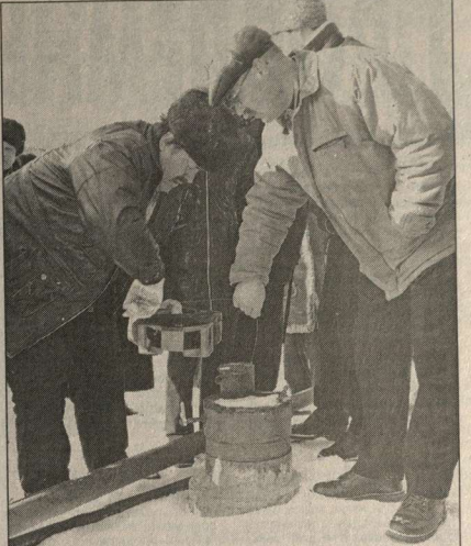
Идет исследование скважины.