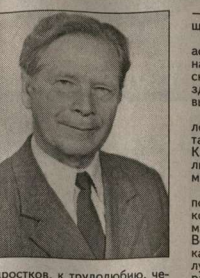
—воздушного боя в авиационных подразделениях. Секретарь партийной ячейки аспирантов МГУ, молчаливый — на глазах соседей по общежитийской комнате, — умирал за здоровьем умирающего брата. И вымолвил исцеление.