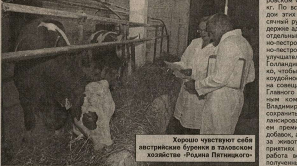
Хорошо чувствуют себя австрийские буренки в таловском хозяйстве «Родина Пятикошского»