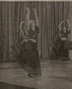
Идет репетиция студии фольклора.

Сперва мы строили храмы, потом взрывали, потом строили на их месте плавающие бассейны, потом взрывали их... Не пора ли остановиться и понять, наконец, что для нормальной жизни нам нужно и то, и другое?