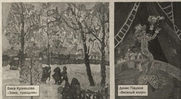
Вика Кузнецова «Зима, праздник»