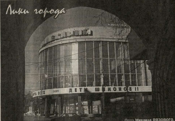
Такая наша жизнь

Юрий ЕРМАКОВ, соб. корр. «Коммуны». Наби АБАДУЛМАНОВ. InoPress.ru - по материалам газеты «Die Welt» (Германия).