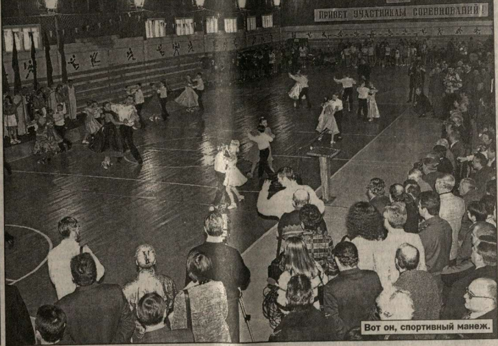
Вот он, спортивный манеж.