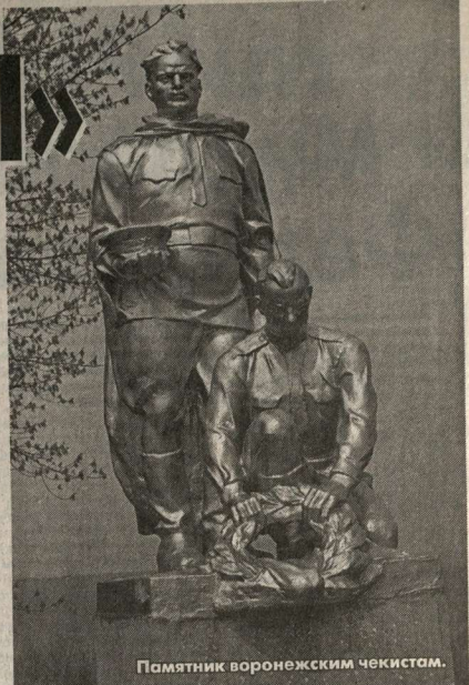
Памятник воронежским чекистам.

Можно и, видимо, нужно где-то сказать, но только не при подготовке разведка-агента или резидента, охватываемого в тылу врага, где любая, даже