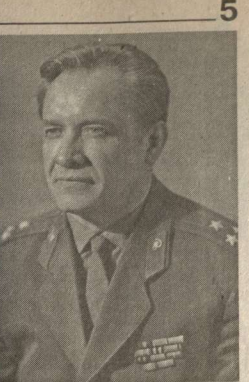
биологов. Особо было выделено значение научных разработок Антипо- ва.

Талантливые ученые Воронеж- е внесли большой вклад в развитие и становление космической медицины, что было отмечено на конференции московских и воронежских космо-