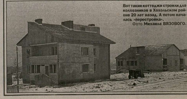
Вот такие коттеджи строят для колхозников в Хохловском районе 20 лет назад. А потом началось «перестройка».