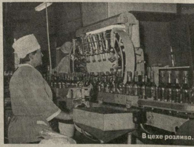
В цехе разлива.

Что предпринимается для того, чтобы защитить вашу продукцию от подделок? По оценкам экспертов на отечественном рынке алкогольной продукции реализуется 40 процентов подделок и только