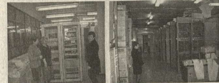
На снимках: сегодня и вчера. Эти две аккуратные стойки с электронными модулями заменили огромный аппаратный зал в Воронежском телеграфе. Новый коммутатор установлен в помещении междугородной АТС, где обеспечивается комфортная для электроники температура и влажность воздуха.

Работники Воронежского телеграфа завершают переключение телеграфных каналов на новое коммутационное оборудование. Эта сложная и ответственная операция — ключевое мероприятие в ходе коренной модернизации этого старейшего подразделения «Воронежсвязьинформ». Переключение каналов производили в течение месяца, в выходные дни и по вечерам, чтобы связь не прерывалась и потребители не испытали неудобств. Две устаревшие телеграфные системы — абонентской телефонной сети и сети общего пользования — на ВМТС заменены на единую электронную станцию от тверской компании «Альфа-Телекс». Для всех абонентов это означает повышение надежности и оперативности услуги, а для связистов — существенную экономию производственных площадей, трудовых и энергоресурсов в этой давно убогой подотрасли. Кроме того, перед абонентами телефонной сети открылась возможность перейти на современные протоколы скорости передачи данных, сохранения традиционных достоинств документальности, гарантированной достоверности в передаче информации.