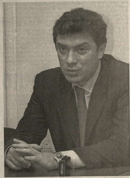
Борис Немцов, лидер фракции СПС в Государственной Думе и наиболее активный представитель правых, можно относиться по-разному. Но одно несомненно: в стране зашумели и начинают набирать обороты огромные маховики предвыборных страстей и баталий. Кто-то становится его жертвой, кого-то вознесет на Олимп славы. Станет ли жизнь россиян от этого лучше?