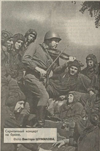
Скрипичный концерт на броне.

В фойе редакции «Коммуны» экспонируются фронтовые снимки старшего фотокорреспондента Черноземья Виктора Егоровича Шумилова. Приурочена выставка ко Дню защитников Отечества. Виктор Егорович прошагал по дорогам войны «с лейкой и блокнотом, а то и с пулеметом» от Москвы до Берлина. Он награжден двумя орденами Красной звезды, орденом Отечественной войны, медалью «За отвагу». О буднях фронтового фотокора он рассказал в своей книге «Раздумья о рейхстаге», изданной в Воронеже два года назад. Виктор СИЛИН.