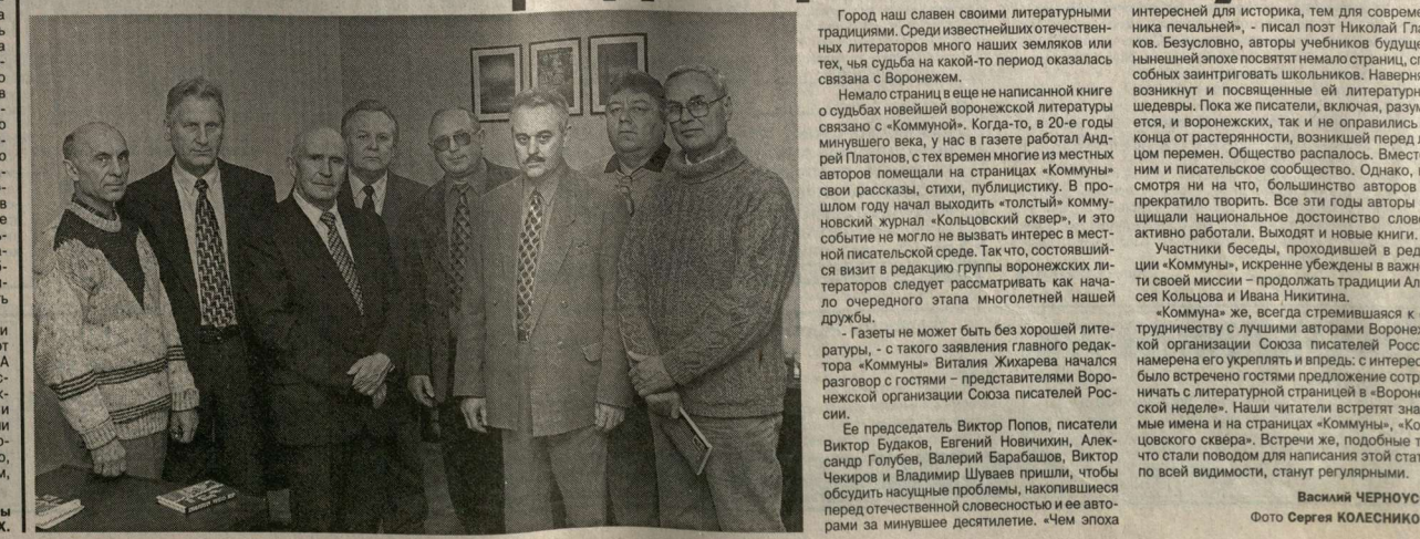
Горд наш славен своими литературными традициями. Среди известных отечественных литераторов много наших земляков или тех, чья судьба на какой-то период оказалась связанной с Воронежем.

Немало страниц в еще не написанной книге о судьбах новейшей воронежской литературы связано с «Коммуной». Когда-то, в 20-е годы минувшего века, у нас в газете работал Андрей Платонов, с тех времен многие из местных авторов помешали на страницах «Коммуны» свои рассказы, стихи, публицистика. В прошлом году начал выходить «толстый» комсомолец не только не вызвал интерес в местной писательской среде. Так что, состоявшийся визит в редакцию группы воронежских литераторов следует рассматривать как начало очередного этапа столетней нашей дружбы.