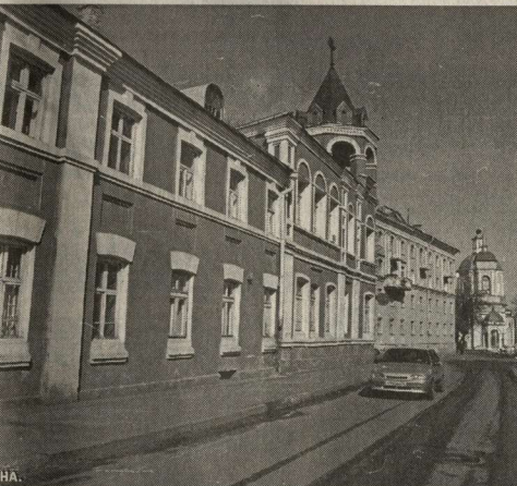
Старый Воронеж.

В первые годы Советской власти наш край сильно «покраснели». Слово «красный» уже не в значении «красивый» (красным островом за красотой тамошних мест называли в конце XVII века свое поселение у Битюга заднепровские казаки-черкасы), а с новым, революционным значением вошло в состав наших казаков. Так, например, свое старинное название переулочек «Садки» переименовал на новое и стал «Крас-