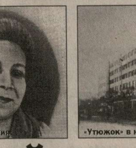
«Утожок» в начале 30-х годов.