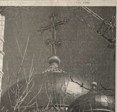
С того момента, когда в Воронеже впервые побывал Святейший Патриарх Московский и всея Руси Алексий II и когда он освятил закладной камень Благовещенского кафедрального собора, прошло без малого пять лет. И вот вознесенье вьсь купола собора, сверкает от золотом на лазурно-синем афтерском небе. Вера бы по-весеннему солнечный день, и наш фоторепондент Михаил ВЯЗОВИЙ снимал и снимал это великолелие. А постройки собора ни на день не останавливаются. К Дням славянской письменности и культуры должны малиновым звоном звонить колокола Благовещенского собора.

Горючо иронично и явное преувеличение говорившие даже не пытались скрывать. Конечно, они, как я понял, имели