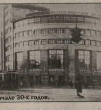
«Утожок» в начале 30-х годов.