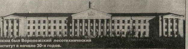
Таким был Воронежский лесотехнический институт в начале 30-х годов.