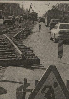
На Ленинском проспекте убирают трамвайное полотно.

недоимщиков. Активное участие, и это мэр отметил с удовольствием, принимают в ремонте дорожного покрытия на самых «разбитых» улицах города и большинство предприятий, расположенных на подлежащих ремонту магистралях, в частности 6-й механический завод, взявший на себя часть расходов по привнесению в нормальное состояние все той же ул. Пешестрелецкой. Объем работ, которые будут произведены по ремонту воронежских улиц в ближайшие две недели, составляет 7,5 млн. рублей. Лорис ГУКАСЯН.