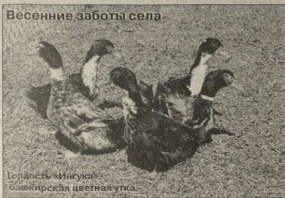
Весенние заботы села