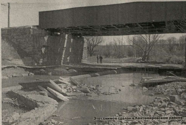
Этот снимок сделан в Кантемировском районе.

Как утверждают эксперты МЧС, нынешней весной в России две беды - пожары и паводки. С одной из них, к сожалению, пришлось столкнуться и нашей области. Талые воды принесли немало бед южным районам края. Особенно пострадали Кантемировский и Петропавловский районы. Здесь были подтоплены десятки жилых домов, разрушено три моста, повреждены дороги, пострадала и сельхозугодья.