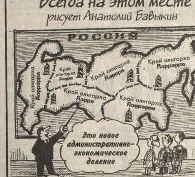
Это новое административно-экономическое деление