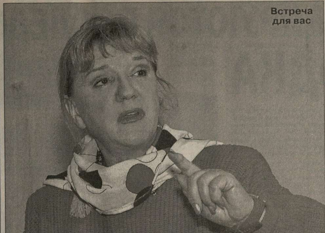
Встреча для вас

Григорий Явлинский, чей образ до сих пор ассоциируется у нас с образом «молодого, подающего надежды экономиста», на самом деле уже давно перешагнул порог, за которым эти надежды надо оправдывать. Григорий Алексеевичу 51 год. Столько же, кстати, и Президенту В.Путину. Но в отличие от Григория Явлинско-