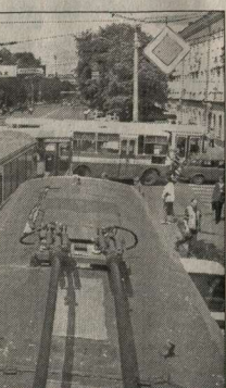
Трамвай на центральном маршруте.

тных сетей на центральных магистрях. В условиях резкого увеличения на городских маршрутах автобусов, принадлежащих частным перевозчикам, острая проблема возникла в диспетчеризации работы пассажирского транспорта. Нередки случаи нарушения водите-