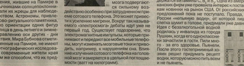
ШОК ШОК ШОК

Идея о безалкогольной водной родильке и мнявила из города Пушкин, когда его отключили от электричества, застал в гости. Пью много — за его здоровье. Пылились. После этого гостеприимный хозяин решил придумать рецепт водки, которую можно пить всем и не пьянеть.