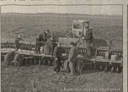
Бригада по севу зерновых.