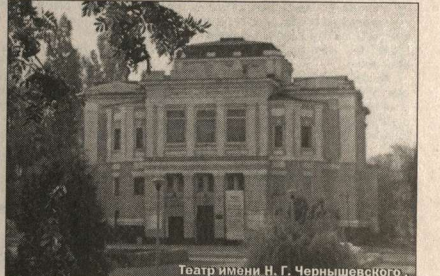
Театр имени Н. Г. Чернышевского.

Рождались новые спектакли, зритель аплодировал, актерам дарили цветы — в общем, то же самое, что и в больших городах, разумеется, включая творческие муки и озарения. Не секрет, однако, что творцу в провинции подчас сложно реализовать себя в полной мере. Психологически вполне можно понять актера