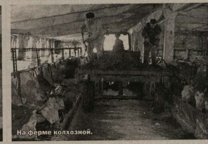
На ферме колхозной.