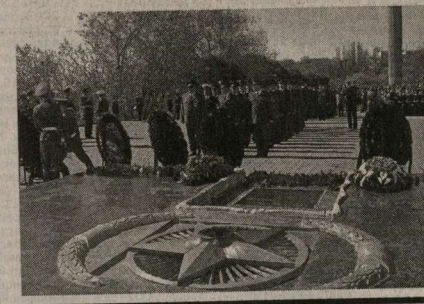
(Окончание на 7-й стр.)

День Великой Победы – праздник всенародный. По традиции он начался с возложения цветов и венков у мемориалов павшим. Участие в этой церемонии приняли руководители области и города. На площади Победы состоялось открытие мемориальной доски воинским частям, удостоенным наименования «Воронежские». Здесь же муниципальной Кадетской школы-интернату вручили боевые знамя. От площади Победы по проспекту Революции к пл.Ленина проследовала колонна ветеранов Великой Отечественной войны.