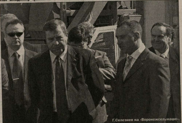
Г.Селезнев на «Воронежсельмаше».