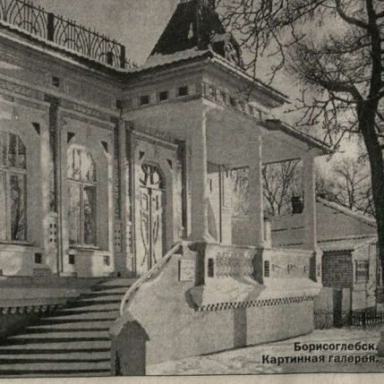
Борисоглебск. Картинная галерея.