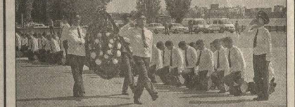
На Адмиралтейской площади Воронежа прошел торжественный выпуск молодых специалистов Воронежского пожарного училища имени МЧС России. После дальнейшую службу выпускники будут проходить в 43 регионах страны.