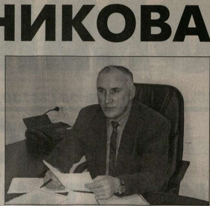
гетайшая аннинская земля использовалась рационально?

«И что делается сегодня в районе для того, чтобы бо-