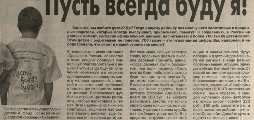
Компания «Орифлайм» активно занимается благотворительностью и регулярно отчисляет средства в Международный детский фонд, основанный шведской королевой Сильвией.