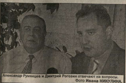
Александр Румянцев и Дмитрий Рогозин отвечают на вопросы.

В заключительной визите прошла пресс-конференция. Первым, кто интересовало журналистов, как впрочем, и всех жителей города, это начало строительства первого энергоблока Ново-воронежской АЭС-2 (чаще его называют шестым блоком).