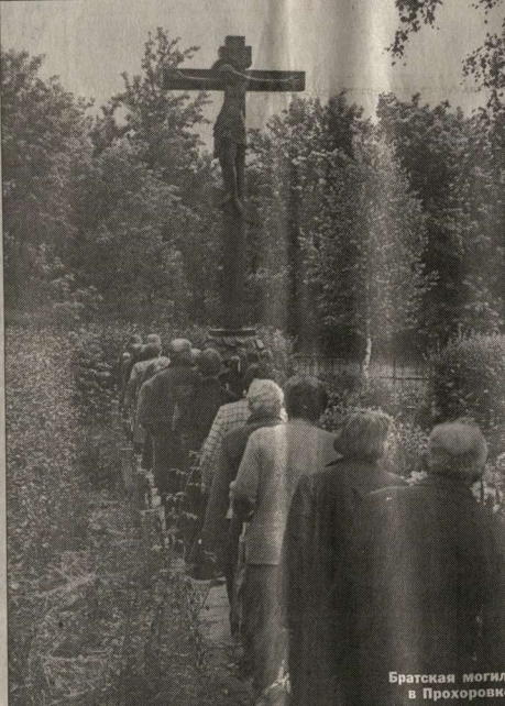
Братская могила в Прохоровке.

В дни празднования 60-летия победы в Курской битве ветераны войны и труда из Нововоронежа посетили легендарное Прохоровское поле, где произошло крупнейшее танковое сражение Великой Отечественной войны. Экскурсию в главах о войнах, погибших в Курской битве, возложили венок на братскую могилу. Такие поездки по местам боевой славы стали традиционными для нововоронежских ветеранов.