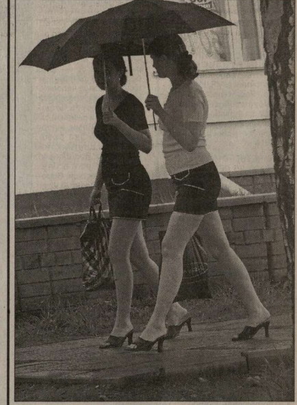
Трудно найти июльский день, когда в Воронеже не было дождя.

По всей стране идет тревога: численность населения катастрофически снижается. Из-за низкого уровня жизни и отсутствия реальной работы о молодых семьях даже один ребенок становится редкостью, а старики все чаще уходят в мир иной. И, тем не менее, медики Бутурлиновского района оптимизма не теряют: в текущем году родилось свыше 150 малышей. Тогда как за аналогичный период прошлого года — 129 мальчиков и девочек.