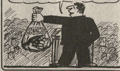
Виталий ЧЕРНИКОВ.