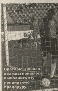
Вратарю «Сокола» пришлось выигрывать эту неприятную процедуру.

Но во втором тайме взрез с обывательской логикой произошла метаморфоза. Волжане были смяты, подавлены,