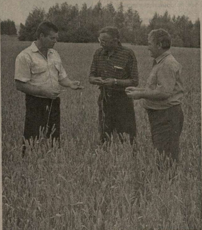
Перед выходом техники на уборку агрономическая служба ЗАО «Инваст-Агропромкомплекс» Бутурлиновского района обследовала поля (на снимке) и сегодня уже комбайны начали работу.