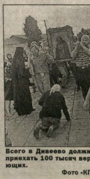
Всего в Дивеево должны прийти 100 тысяч верующих.