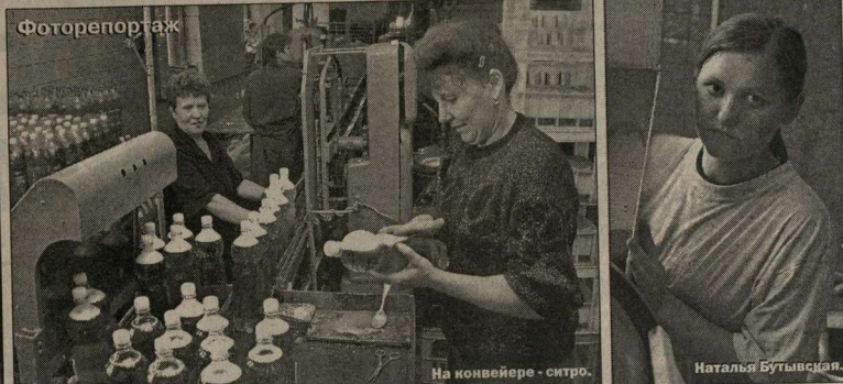
На конвейере - ситро.