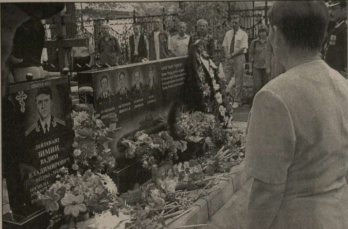
Памятник морякам-подводникам усыпаны цветами.