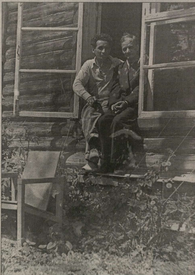
Давид Ясиновский и Андрей Платонов на даче в Клязьме, Московская область. 1939 год. Публикуются впервые.