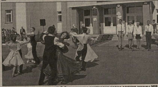
В Острогожске построено новое здание школы №8.