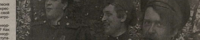
Рабочий момент съемок программы «Лепти».