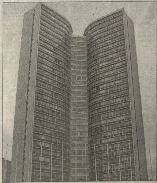
Здание правительства Москвы.