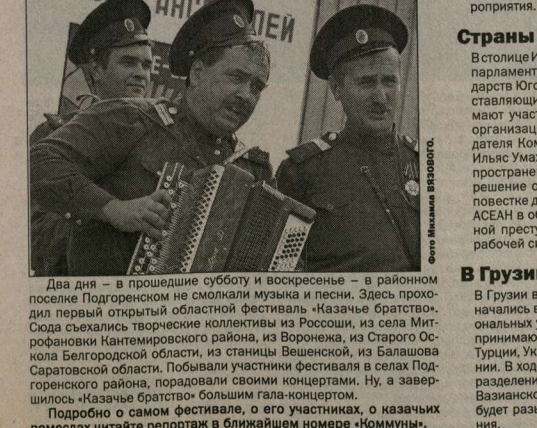
Два дня – в прошедшие субботу и воскресенье – в районном поселке Подгоренском со смолкали музыка и песни. Здесь проходил первый открытый областной фестиваль «Казачье братство». Сюда съехались творческие коллективы из Россохи, из села Митрофановки Кантемировского района, из Воронежа, из Старого Оскала Белгородской области, из станции Ушенский, из Балашова Саратовской области. Побывали участники фестиваля в селах Подгоренского района, порадовали своими концертами. Ну, а завершилось «Казачье братство» большим гала-концертом. Подробно о самом фестивале, о его участниках, о казачьих ремеслах читайте репортаж в ближайшем номере «Коммуны».