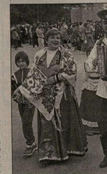
Подгоренский ансамбль «Русская забава».