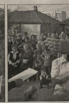
Сейчас на улицу Врубеля любо-дорого смотреть.