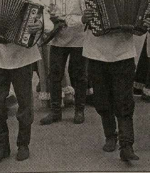
При станции «Пристанской».