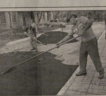
Положен новый асфальт, заменены столбы линий электропередачи. Посадили клубы цветов.

Жители дома № 2 по улице 40 лет Октября тоже получили предпринятый подарок. На голем месте здесь выросла прекрасная детская площадка, которая заняла первое место на городском смотре-конкурсе дворовых территорий.