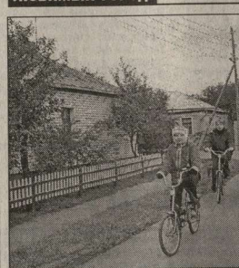
Положен новый асфальт, заменены столбы линий электропередачи. Посадили клубы цветов.

Жители дома № 2 по улице 40 лет Октября тоже получили предпринятый подарок. На голем месте здесь выросла прекрасная детская площадка, которая заняла первое место на городском смотре-конкурсе дворовых территорий.