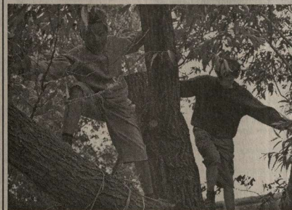
Откуда у парня африканская грусть? Эти снимки Сергей Колесников сделал в Новоусманском районе.