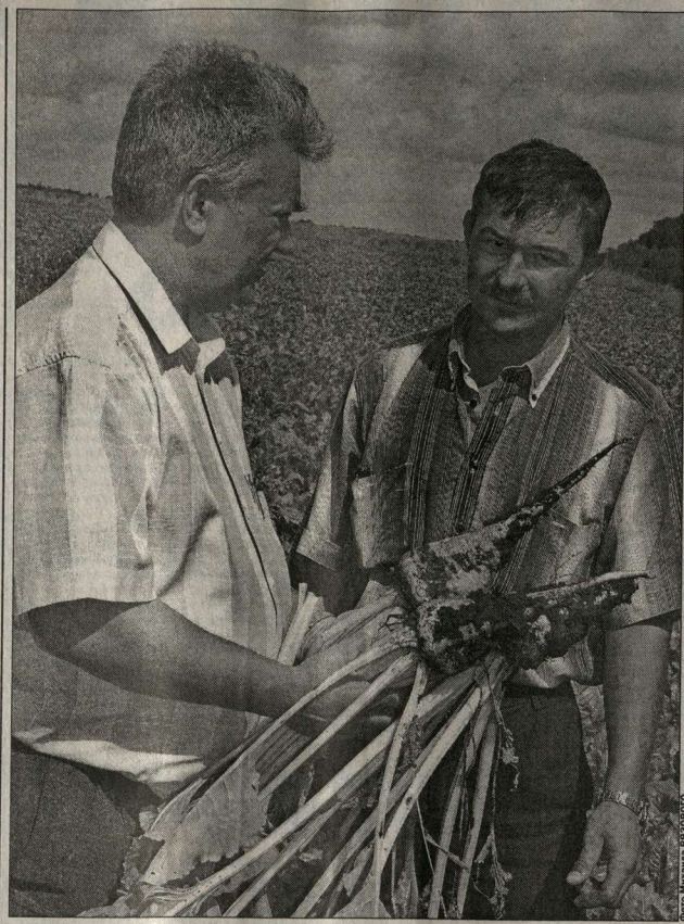
Семья Иванова.