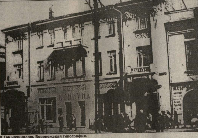
Так начиналась Воронежская типография.