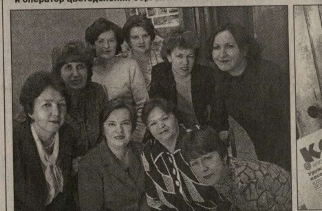
Портрет плано-производственного отдела.