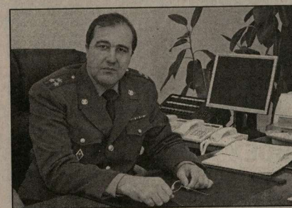
Видеокадры из фильма «Судья»