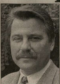
неразберихи в сфере платных медицинских услуг. При этом притом их непременно в душе. Условно является обязательной по той простой причине, что в защите нуждаемся не только мы, пациенты.

Сергей Викторович, существенно повлиял на состояние здоровья населения и демографическую ситуацию в целом. Впервые закреплена прямая ответственность физических и юридических лиц за свое здоровье и ущерб, который они могут причинить нездоровью и имуществу других лиц. Введено в действие система санитарной охраны административных границ области, препятствующая экспорту особо опасных инфекций и недоброкачественных продуктов. В одной из глав закона четко прописаны требования безопасности среды обитания человека. Цель разработчиков — обеспечить комфортные с санитарно-эпидемиологической точки зрения, условия проживания в Центральном Черноземье.