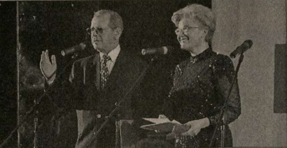
Ведущие Аркадий Арканов и Елена Малышева.