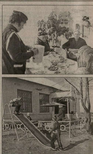
Магазин в Воронцовке.