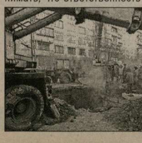
ЖКХ: уже теплее, но проблемы остаются