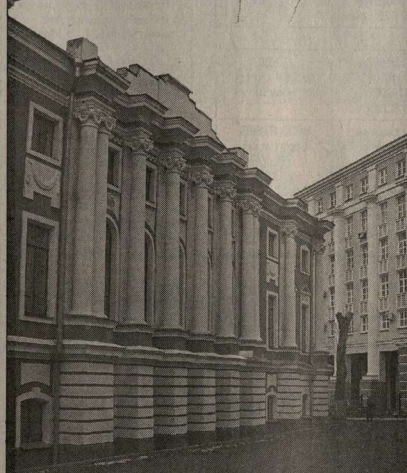
Новые этажи старого Воронежа.