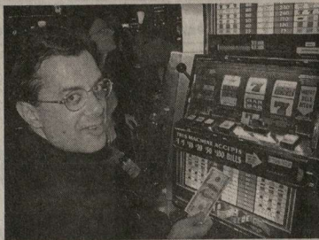
Владельцы игровых автоматов с дежурным выигрывают.

Не секрет, что игорный бизнес является весьма прибыльным занятием. Получив лицензию на этот вид деятельности, поставив автоматы, исправно платя налоги и получая хорошую прибыль, благо, что человечество испокон веков любило острые ощущения. Однако не все так просто, оказывается, в игровом «коровстве». По оперативным данным правоохранительных органов, в Воронеже более тысячи игровых автоматов были установлены незаконно. А это значит, что они не поставлены на налоговый учет или у их владельцев отсутствуют лицензии. Поскольку налоговые поступления с каждого такого автомата должны в нынешнем году составлять по 3750 рублей в месяц, нетрудно подсчитать, что городской бюджет недополучает ежемесячно кругленькую сумму - примерно 4 миллиона рублей.