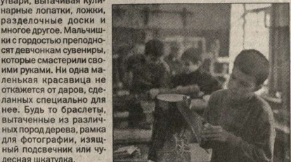
Этим ребятами как сет большой радости, так и гордости занимаются ребятами, которые смастерили своими руками. Ни одна маленькая красавица не откажется от даров, сделанных специально для нее. Будь то браслеты, вытасченные из различных пород дерева, рамка для фотографии, излучающий подвесчик или чудесная шапка.

Кроме уроков труда при школе №28 есть кружок «Волшебное дерево», где ребята с пылкостью восьмилетних изобретателей используют разные деревянные породы. Они радуют своим самодельными предметами кухонной утвари, вытасывая кулинарные лопатки, ложки, разделочные доски и многое другое. Мальчишки с гордостью преподносят дедкам сувениры, которые смастерили своими руками. Ни одна маленькая красавица не откажется от даров, сделанных специально для нее. Будь то браслеты, вытасченные из различных пород дерева, рамка для фотографии, излучающий подвесчик или чудесная шапка.