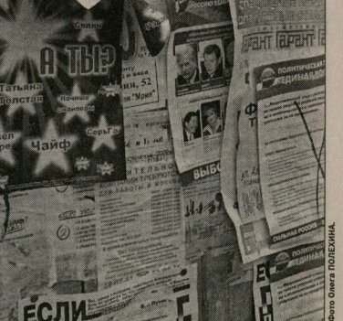
Ненаглядная агитация еще долго будет напоминать воронцам о выборах.

Отсутствие в российском парламенте представителей демократических партий - большая потеря для него и для общества. Никто не отрицает, что депутаты от «Яблока» - это высокопрофессиональные юристы, экономисты, специалисты по различным другим отраслям, одним словом, мозги прежней Думы. В новом составе депутатского корпуса ожидается полная оппозиция одной партии - без оппозиционной стороны. По сути, это Верховный Совет 60-80 годов прошлого столетия. К чему это приведет, сказать сложно, но нельзя не выразить тревоги о будущем российской демократии. Она под угрозой. Так что в этом смысле оптимизма у нас мало. Президент, правда, высказал такую мысль, что все конструктивные предложения, обнародованные в ходе выборов, будут изучены и реализованы. Но говорить об этом - одно, делать - другое. Подобных заявлений мы уже слышали немало. Если говорить о наших планах на будущее, то их определяет в том числе и наша структура с другими демократическими силами. Будем идти по пути к сближению всех демократических сил общества.