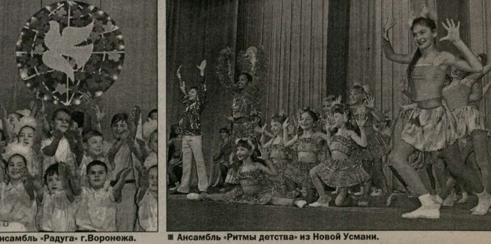
■ Ансамбль «Молодость» из Борисоглебска. ■ Ансамбль «Радуга» г.Воронежа. ■ Ансамбль «Ритмы детства» из Новой Усмани.