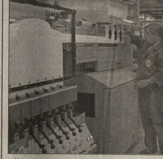
Уникальная «сигаретная» машина на «Яве».

личными веществами и употребляли для лечения простуды, головной и зубной боли, кожных и инфекционных заболеваний. В России только в 1693 году царь Петр Первый официально снял запрет на курение и разрешил табачную торговлю. Кусочек южного острова в сердце страны Находящаяся «табачная лихорадка» охватила практически всю страну только к концу девятнадцатого века. Именно в это время (в 1856 году) карамским купцом Самуилом Габеем в Москве была открыта небольшая табачная мастерская, которая всего через несколько десятков лет стала крупнейшим предприятием Москвы, впоследствии, старейшим в России. В 1922 году, в результате национализации фабрики официально было присвоено название «Ява». Откуда столь экзотическое для России имя? Дело в том, что папиросы с таким названием стали производиться здесь с 1912 года из табака, привезенного с индонезийского острова Ява. А в годы Первой мировой войны папиросы стали не только товаром личного пользования, но и предметом оборонного значения. Даже во время Гражданской войны фабрика не останавливалась ни разу. Долгое время «Государственная фабрика №2», а затем «Ява», была не просто табачным производством, но и центром политической жизни страны. С ней ассоциировалось новое время, революционный дух. К примеру, «певец революции» Владимир Маяковский не случайно занимался «рекламой» сигарет: «Новое время.